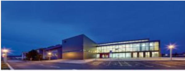
SPORTSKA DVORANA ZABOK